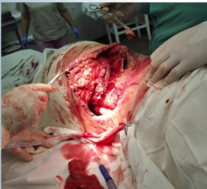
etapele de prelucrare chirurgicală al leziunii deschise

Rezultatul invenției constă în stabilizarea prealabilă ainelului pelvin cu un dispozitiv de fixare externă cu menținerea raportului structurilor anatomice traumatizate în localizarea lor reciprocă inițială, evitarea riscului de traumatism suplimentar și infecție în timpul prelucrării chirurgicale etapizate a plăgii, se obține datorită fixării stabile a fragmentelor osoase de bază aleinelului pelvin și a creării unui acces controlat vizual în toate zonele afectate ale țesuturilor cu traumatizare secundară minimă, se efectuează re poziționarea fragmentelor osoase uni-momentan sau treptat și fixarea lor stabilă cu crearea unei aspirații active permanente în plagă cu ajutorul unui dispozitiv de formare a presiunii negative.