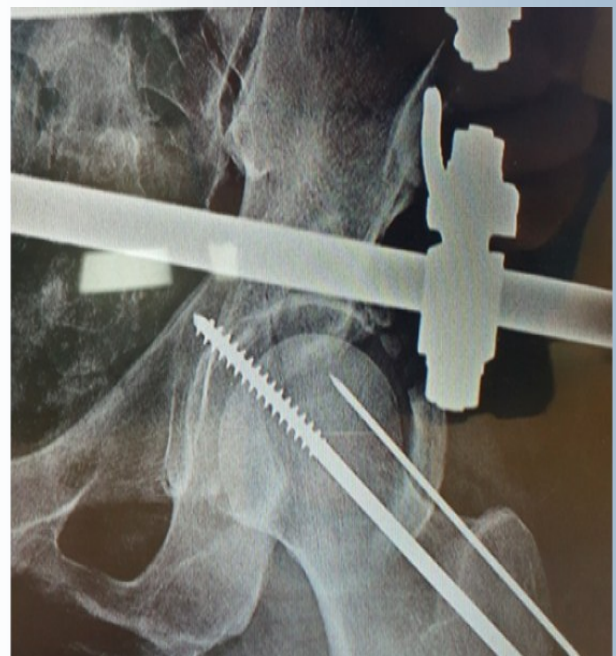
fragment de radiograma anteroposterioară ainelului pelvin: diafixarea articulației coxofemorale stângi cu introducerea unui element de fixare pe axa centrală a colului femoral